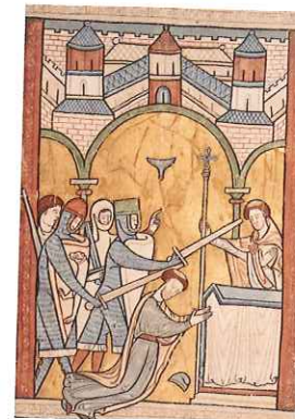
Arcybiskup Tomasz Becket został zamordowany w 1170 r. w katedrze w Canterbury na polecenie króla Anglii Henryka II. W ten brutalny sposób władca pozbył się przeciwnika w sporze dotyczącym poddania angielskiego duchowieństwa sądownictwu królewskiemu w sprawach karnych.

W 1123 r. I sobór laterański rozszerzył postanowienia konkordatu wormackiego na wszystkie państwa chrześcijańskie. Tempo wdrażania reformy gregoriańskiej było różne w poszczególnych krajach i zależało od okoliczności politycznych oraz pozycji Kościoła. Na tym tle wybuchały lokalne konflikty. Najsłynniejszym z nich był wieloletni spór dotyczący rozgraniczenia jurysdykcji królewskiej i kościelnej między królem angielskim Henrykiem II a arcybiskupem Canterbury Tomaszem Becketem.