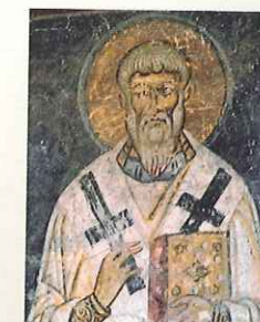
Patriarcha do dziś jest najwyższym dostojnikiem w poszczególnych niezależnych cerkwiach prawosławnych, szczególnie rolę zachowali jednak patriarchowie Konstantynopola i Moskwy.

W miarę upływu czasu pogłębiały się różnice cywilizacyjne między Europą Zachodnią a Bizancjum. Nasiliły się uprzedzenia oraz wzajemna nieufność pomiędzy papieżem a patriarchatem Konstantynopola. W połowie XI w. papieństwo zaangażowało się w reformę Kościoła zainicjowaną przez mnichów z opactwa w Cluny. Duchowni bizantyjscy obawiali się, że papież zechce również im narzucić program reform, a tym samym podporządkuje sobie Kościół wschodni. Do tego doszły narastające przez wieki nieporozumienia dotyczące kwestii liturgicznych, dyscyplinarnych i obyczajowych. Kościół katolicki oskarżano o używanie podczas mszy praśnego chleba (na wschodzie używano zakwaszonego), rezygnację księży z zarostu oraz propagowanie celibatu. W odpowiedzi wysłannik papieski w 1054 r. ekskomunikował patriarchę Konstantynopola. Tamtejsze duchowieństwo i ludzie świeccy poparli swojego zwierzchnika duchowego. Na zwołanym przez niego synodzie zgodnie potępiono działalność papieństwa. Tak doszło do wielkiej schizmy wschodniej, czyli rozłamu w chrześcijaństwie na Kościoły wschodni i zachodni. Przedstawiciele Kościoła bizantyjskiego uważali go za jedyny prawdziwy, dlatego zaczęto określać ten obrządek mianem „prawosławnego”. Zwierzchnicy Kościoła rzymskiego twierdzili, że tylko on jest powszechny, stąd nazwa: „katolicki” (gr. katholikos – ‘powszechny’).