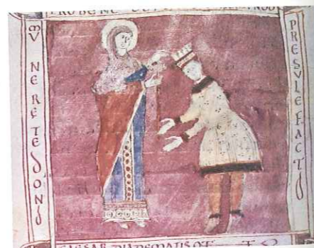
Koronacja Ottona I na cesarza odbyła się w 962 r. w Rzymie. Na miniaturze diadem cesarski wkłada na głowę władcy Maryja. Państwo Kościelne i papieżstwo, przeżywające wówczas głęboki kryzys, znalazły się pod protekcją Ottona I i jego następców. Odnowione na Zachodzie cesarstwo nawiązywało do tradycji imperium Karola Wielkiego.

Rozpad imperium Karolingów przyczynił się do zamętu politycznego w Rzymie i sprawił, że w X w. papieżstwo przeżyło głęboki kryzys. O obsadzie tronu papieskiego decydowały wpływowe rody arystokratyczne, które zaciekle ze sobą rywalizowały i wszczynały krwawe konflikty. Zasiadali na nim kandydaci niegodni tego stanowiska, czasem także synowie poprzednich papieży. W tym okresie pontyfikaty trwały krótko i były brutalnie przerywane. Rozpowszechnił się