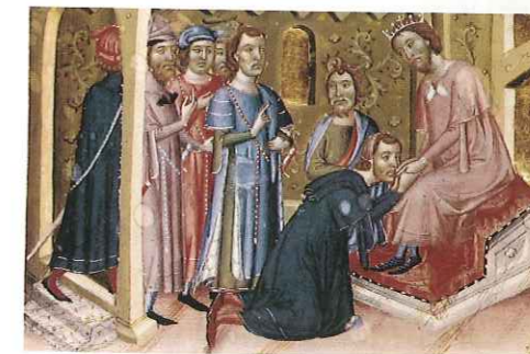
Złożenie hołdu lennego wiązało się często z uroczystym przekazaniem inwestytury i ziemi. Na ilustracji przedstawiono duchownego, który składa przysięgę wierności królowi Aragonii Jakubowi I i staje się jego wasalem.

Na pogłębienie się kryzysu w Kościele miały też wpływ rozpad imperium Karolingów oraz najazdy Normanów, Węgrów i Arabów. Doprowadziły one do upadku wielu klasztorów, które stały się łupami najeźdźców i zostały opuszczone przez mnichów. Pozostałe często traciły swoje majątki i stawały się zależne od okolicznych możnowładców. Wprawdzie klasztory w najmniejszym stopniu ulegały zeświecczeniu, jednak doszło w nich do zaniku dyscypliny i rozkładu duchowości zakonnej.