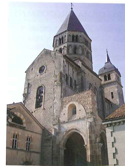
Benedyktyńskie opactwo w Cluny jedynie w części zachowało się do naszych czasów. Zostało ufundowane w 909 r. i szybko zdobyło ogromne wpływy. Pod koniec XI w. kongregacja kluniacka liczyła ok. 10 tys. mnichów w całej Europie.

W kongregacji kluniackiej sformułowano program odnowy życia religijnego w całym Kościele. Uznano, że jednym z warunków jej powodzenia jest uwolnienie Kościoła od świeckiej inwestytury. Poza tym chciano zakazać symonii, gdyż stanowiska kościelne wiążące się z własnością ziemską i władzą stały się obiektami targów. Ostatni postulat dotyczył zakazu nikolaizmu – księża nie mogliby zawierać małżeństw i mieć dzieci. Wprowadzenie obowiązkowego celibatu miało uniezależnić kapłanów od społeczeństwa feudalnego oraz upodobnić ich pod względem stylu życia i rodzaju pobożności do zakonników.