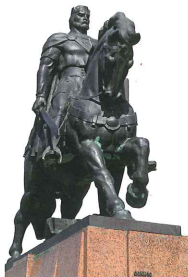
Król Daniel Halicki w połowie XIII w. zjednoczył Księstwo Halicko-Wołyńskie, które stało się jednym z ważniejszych państw na terenach rozbitej Rusi. Zgodnie z legendą monarcha założył miasto Lwów, nazwane tak od imienia jego syna, Lwa.

Dla Czech, rządzonych przez Przemyślidów, XIII w. był epoką rozkwitu. Kraj ten stał się wówczas najpotężniejszym sąsiadem Polski. W przeciwieństwie do niej nie doszło tam do rozbitcia dzielnicowego. Co więcej, Przemysław Ottokar I , dzięki poparciu udzielonemu rodowi Staufów w walce o tron niemiecki, w 1198 r. otrzymał od cesarza dziedziczny tytuł królewski, uznany także przez papieża. Nowy status Królestwa Czeskiego, pozostającego częścią cesarstwa rzymskiego, został potwierdzony w 1212 r. przez cesarza Fryderyka II. W XIII w. królowie czescy, noszący tytuł arcyceśników, weszli w skład kolegium siedmiu elektorów wybierających władcę niemieckiego.