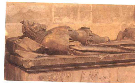
Przemysław Ottokar II był pierwszym władcą Czech, który zyskał ogromne wpływy w Rzeszy i starał się o koronę niemiecką. Brał również udział w wyprawach przeciwko Prusom jako sojusznik zakonu krzyżackiego. Na jego cześć założono zamek o nazwie „Królewiec”. Jego 25-letnie panowanie zakończyła śmierć w bitwie pod Suchymi Krutami (1278 r.).

W XIII w. w Czechach, znacznie bardziej niż w innych państwach Europy Środkowej, wzrósł potencjał ludnościowy i gospodarczy. Był to efekt szczególnie intensywnej kolonizacji na prawie niemieckim. Czechy stały się wówczas krajem zurbanizowanym, z rozwiniętą gospodarką pieniężną. Wiodącą dziedzinę stanowiło górnictwo srebra oraz – w mniejszym stopniu – złota. Wzrosły dochody monarchii, a czeski grosz od XIII w. był najpopularniejszą monetą w Europie Środkowej.