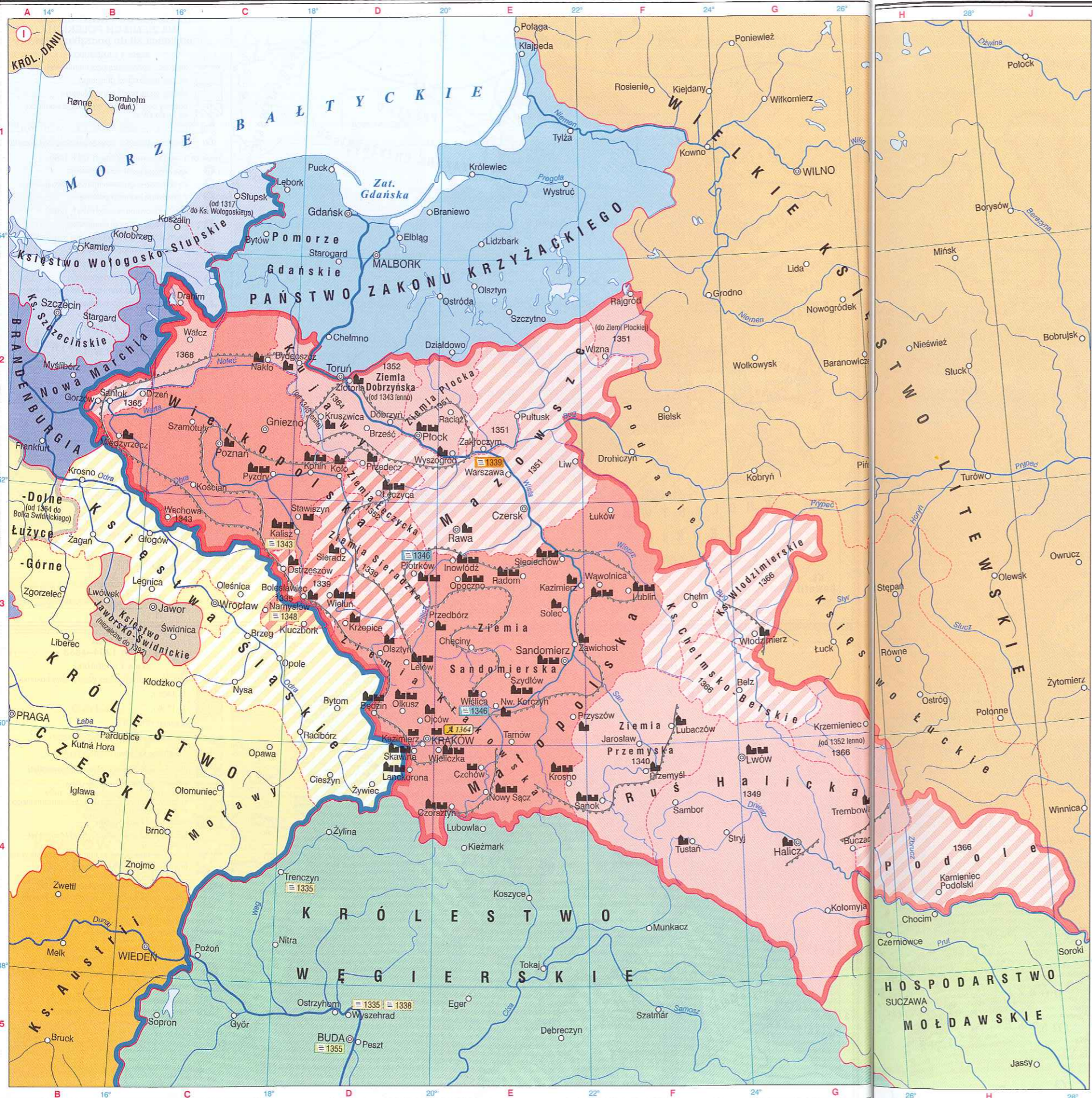
KRÓLESTWO POLSKIE ZA PANOWANIA KAZIMIERZA WIELKIEGO W LATACH 1333-1370 skala 1 : 4000000