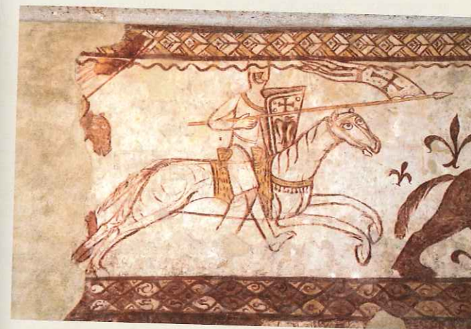
Templariusz podczas natarcia został przedstawiony na fresku zdobiącym kaplicę templariuszy w Cressac-Saint-Genis. Wstępujący do Zakonu Ubogich Rycerzy Chrystusa i Świątyni Salomona składali śluby ubóstwa i braterstwa. Wartości te symbolicznie ukazano w jego herbie, który przedstawia dwóch braci zakonnych siedzących na jednym koniu.