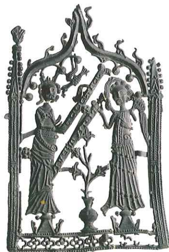
Plakietka pielgrzymia ukazuje scenę Zwiastowania Najświętszej Marii Panny. Tego typu metalowe ozdoby przedstawiające świętych nosili przyśzyte do ubrań pielgrzymi wędrujący do odległych sanktuariów.

W XI w. sytuacja polityczna na Bliskim Wschodzie była skomplikowana i niestabilna. O przywództwo w tym regionie rywalizowały dwa kalifaty: bagdadzki i kairski. Pierwszy z nich należał do rodu Abbasydów, który wywodził się od Abu al-Abbasa, stryja Mahometa. Drugim rządzili członkowie rodu Fatymidów, uważający się za potomków kalifa Alego i jego żony Fatimy, córki proroka. Fatymidzi w IX w. zdobyli władzę w Tunezji, a na początku następnego stulecia opanowali Egipt i uczynili Kair stolicą swojego kalifatu. Każdy z rodów uważał adwersarzy za uzurpatorów.