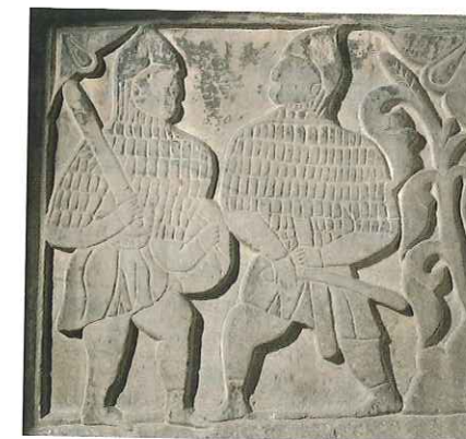
Wojownicy seldżuccy byli wyposażeni w spiczaste helmy, pancerze i tarcze oraz lekkie miecze. Doskonale radzili sobie zarówno w otwartym starciu, jak i podczas obrony fortyfikacji.

Do rozpoczęcia krucjat przyczyniły się również postulaty głoszone przez członków ruchu pokoju bożego (łac. treuga Dei ), ukształtowanego w drugiej połowie X w. w południowej Francji i cieszącego się przychylnością hierarchów kościelnych. Aby powstrzymać feudalną anarchię oraz prywatne zatargi, popierani przez możnowładców i rycerzy duchowni ogłaszali na lokalnych synodach dekrety ograniczające pod groźbą kar kościelnych samowolę w prowadzeniu walk. Na mocy tych dokumentów brano również pod opiekę bezbronnych (kobiety, dzieci, kupców, pielgrzymów, księży). Działania zbrojne można było prowadzić tylko w określone