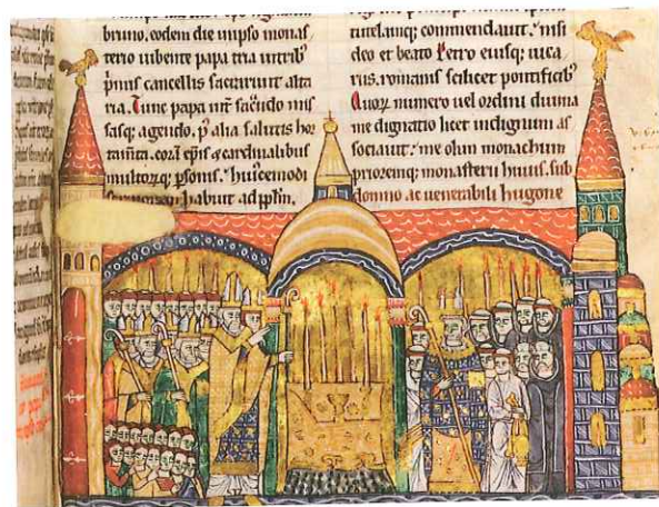
Urban II na synodzie w Clermont po raz pierwszy wezwał chrześcijan do krucjaty. Powodzenie tej wyprawy zwiększyło wpływy polityczne papieża w Europie, a tym samym wzmocniło jego pozycję w sporze z cesarzem o inwestyturę.

Wiosną 1096 r. z południowych Niemiec i północnej Francji wyruszyły na Wschód rzesze ludzi: zubożała szlachta, chłopci, mieszczenie, kobiety, dzieci, a nawet ludzie z marginesu. Był to ruch spontaniczny, dlatego wyprawa ta jest określana jako krucjata ludowa . Jej liczebność ocenia się nawet na 200 tys. ludzi. Przywódcami byli fanatyczni kaznodzieje Walter bez Mienia i Piotr Eremita . Roztaczali oni przed uczestnikami krucjaty wizje natychmiastowego zbawienia. Niezdyscyplinowane tłumy dopuszczały się jednak po drodze licznych gwałtów i rabunków, dochodziło także do pogromów ludności żydowskiej, obarczanej winą za śmierć Chrystusa. Część pątników została rozbита już w Europie przez władcę Węgier, który wystąpił w obronie swoich poddanych. Resztę w Anatolii z łatwością rozgromili Turcy.