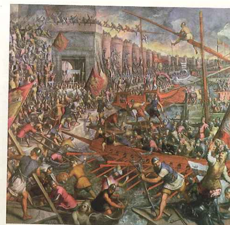
Zdobycie Konstantynopola przez krzyżowców w 1204 r. było motywowane interesami handlowymi Republiki Wenecji. Efekty zwycięstwa uczestników IV krucjaty okazały się jednak nietrwale, a sama wyprawa przede wszystkim pogłębiła podziały między katolikami a prawosławnymi.

Odrębne miejsce w historii wypraw krzyżowych zajmuje IV krucjata. Statki potrzebne do przetransportowania wojsk do Ziemi Świętej mieli dostarczyć Wenecjanie w zamian za liczne przywileje handlowe oraz zapłatę. Kiedy się okazało, że krzyżowcy nie dysponują środkami na opłacenie przeprawy, Wenecjanie zgodzili się przyjąć niższą kwotę, ale zażądali zdobycia przez uczestników krucjaty miasta Zadar w Dalmacji, należącego do władcy Węgier. Po wykonaniu tego zadania przez krzyżowców doża wenecki postawił kolejny warunek – mieli oni zaatakować Konstantynopol. Namawiał ich do tego także pretendent do tronu bizantyjskiego Aleksy IV. W zamian za zdobycie i przekazanie mu stolicy Bizancjum obiecywał im wartościowe dary, pomoc wojskową w trakcie krucjaty oraz unię Kościoła greckiego z Rzymem. Uczestnicy wyprawy zgodzili się na te propozycje. Jednak gdy w 1203 r. Aleksy z ich pomocą objął tron, okazało się, że nie zamierza dotrzymać umowy. Wybuchła wówczas wojna między rycerstwem europejskim a Bizancjum, zakończona w 1204 r. zdobyciem i złupieniem przez krzyżowców Konstantynopola. Ustanowiono tam cesarstwo łacińskie, które przetrwało do 1261 r. IV wyprawa krzyżowa okazała się kompromitacją ruchu krucjatowego.