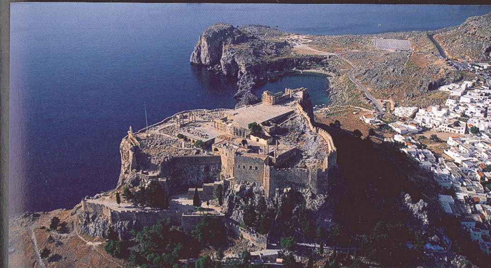
Akropol w mieście Lindos na Rodos był wykorzystywany nie tylko przez starożytnych Greków. W kolejnych stuleciach jego obronne walory wykorzystywali m.in. Bizantyjczycy, Turcy i joannici. Na szczycie wzgórza zachowały się antyczne ruiny świątyni Ateny.

2. Mury obronne chroniły miasto przed napaścią wrogów i przed dostawaniem się do niego niepożądanych osób.