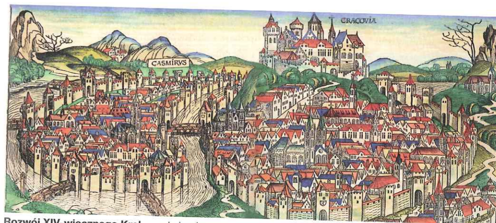
Rozwój XIV-wiecznego Krakowa był związany ze zwiększeniem wymiany handlowej, w której m.in. specjalizowała się napływająca na ziemie polskie ludność żydowska. Zamieszkiwała ona ulokowane dla niej nowe miasto – znajdujący się obok Krakowa Kazimierz, nazwany tak od imienia króla Kazimierza Wielkiego. W 1334 r. potwierdzono nadany przez Bolesława Pobożnego w 1264 r. przywilej czyniący z Żydów odrębną grupę społeczną, określaną mianem „sług skarbu”, która miała ogromne znaczenie dla finansów królestwa. Polityka lokacyjna miała przynieść długoterminowe skutki.

Za panowania Kazimierza Wielkiego nastąpił rozwój sieci dróg handlowych, na co korzystnie wpływała rosnąca liczba miast. Niektóre ośrodki, takie jak Kraków czy Lwów, odgrywały ważną rolę w dalekosiężnej wymianie handlowej. Król wspierał również rozwój handlu krajowego i w tym celu wprowadził dwie uzupełniające się regulacje prawne. Pierwszą z nich był przymus drożny, nakazujący obcym kupcom przemieszczanie się tylko po wyznaczonych drogach, na których znajdowały się polskie miasta objęte protekcją króla. Na tych trasach pobierano cło. Drugą regulacją stanowiło prawo składu – w objętych nim miastach kupcy z zagranicy musieli wystawiać swoje towary na sprzedaż przez określony czas. Ułatwiło to miejscowym handlarzom włączenie się do wymiany handlowej poprzez kupowanie i odsprzedawanie towarów. Dużą rolę w ożywieniu handlu odegrało także włączenie Rusi do Królestwa Polskiego oraz ze Wschodem, gdzie sięgał on aż do Morza Czarne. Polski władca podpisywał również umowy wzajemne z wybranymi państwami i miastami, co ułatwiało kupcom poruszanie się i prowadzenie wymiany handlowej. Wszystkie te działania prowadziły do rozwoju polskich miast.