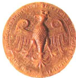
Pieczęć majestatyczna Kazimierza Wielkiego , na której awersie znajdował się piastowski orzeł w koronie, była przytwierdzana do najważniejszych dokumentów wydawanych przez władcę.

W kontaktach międzynarodowych pierwszą decyzją podjętą przez młodego króla było przedłużenie rozejmu z Krzyżakami o kolejny rok. Następnie władca zawarł układ z Brandenburgią. Co prawda dotyczył on tylko zwalczania rozbójnictwa, lecz pozytywnie wpłynął na relacje pomiędzy państwami i osłabił sojusz brandenbursko-krzyżacki, skierowany przeciwko Polsce.