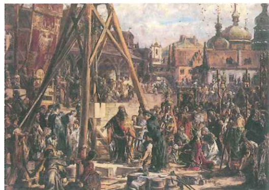
Powtórne zajęcie Rusi Jana Matejki w symboliczny sposób przedstawia włączenie księstw ruskich do Korony Polskiej oraz towarzyszące mu wydarzenia i procesy historyczne. Dzieło prezentuje wmurowanie kamienia węgielnego pod katedrę metropolitalną we Lwowie. W uwiecznionej ceremonii uczestniczą nie tylko przybyli z Polski katolicy, lecz także duchowni prawosławni, zholdowani książęta ruscy oraz widoczny w lewym dolnym rogu Żyd.

Dzięki podbiciu Rusi Kazimierz Wielki nie tylko zwiększył terytorium i potencjał Królestwa Polskiego, lecz także wyznaczył nowy kierunek ekspansji. Od tej chwili zainteresowania polityczne państwa polskiego przesunęły się wyraźnie na wschód. Zagwarantowano wolność wyznania dla wszystkich mieszkańców tych terenów i szanowano lokalne prawa. W wyniku opanowania Rusi Czerwonej w państwie polskim znacząco wzrosła liczba wyznawców prawosławia, które było dominującą religią w Europie Wschodniej. W całym państwie rozwijały się handel i wymiana kulturowa. Podbój terenów wschodnich miał jednak także negatywne skutki – odwrócił m.in. uwagę od Śląska i Pomorza, a tym samym przyczynił się do mniejszej aktywności na rzecz odzyskania tych terenów.