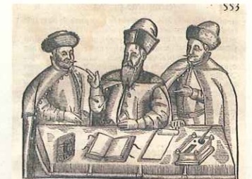
Komplet sądu ziemskiego , czyli sędzia, podsędek i pisarz, od XV w. był wybierany przez sejmiki szlacheckie. Ilustracja pochodzi z kompilacji aktów prawnych autorstwa Stanisława Sarnickiego

W Rzeczypospolitej każdy stan społeczny podlegał odrębnemu prawu. Stosunki między szlachtą regulowało prawo ziemskie. Za te same przestępstwa przewidywało ono łagodniejsze kary niż prawo miejskie dla mieszczan czy wiejskie dla chłopów. Za zamordowanie chłopu szlachcic był karany wniesieniem opłaty na rzecz rodziny ofiary, podczas gdy wobec mieszczan i chłopów orzekano karę śmierci. Gdy już skazano szlachcica na śmierć, wyrok wykonywano poprzez ścięcie mieczem – nie uciekano się do kar bardziej okrutnych i hańbiących (np. powieszenie). W postępowaniu sądowym nie można było także wobec szlachetnie urodzonego stosować tortur (jedynie w przypadku oskarżenia o zbrodnię przeciwko królowi).