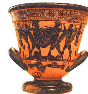
Wizerunek walczących greckich wojowników zdobi wazę wykonaną w stylu czarnofiguralnym. Pokazano na niej główne elementy ich uzbrojenia – helmy z grzebieniem, włócznie, tarcze, nagolenniki i pancerze – oraz sposób walki. Z drugiej strony warto pamiętać, że przedstawienia na wazach mogą też wprowadzać w błąd. Na przykład wiemy, że hoplici greccy nie zawsze walczyli w pełnym uzbrojeniu, a ich ekwipunek cechowała duża różnorodność.

Spartanin, który stchórzył, po powrocie z wojny stawał się obiektem prześladowań. Musiał nosić hańbiący strój z kolorowymi łatanami i golić jedynie połowę włosów. Ponadto każdy napotkany obywatel mógł go bezkarnie uderzyć.