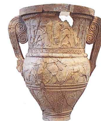
Krater , w którym mieszano wino z wodą, został wykonany w Sparcie. Naczynie zdobi m.in. scena polowania na lwy z udziałem psów.

Od czasów Likurga w Sparcie panowały surowe obyczaje, równość majątkowa oraz absolutny prymat dobra wspólnego nad interesem jednostki. Zdaniem historyków jednocześnie w polis tej zepchnięto na margines kulturę, której tworzenie wiązało się z indywidualizmem. Sparta miała stać się na wieki pustynią intelektualną. Wykopaliska archeologiczne prowadzone na jej terenie dowiodły jednak czegoś zupełnie innego. W VIII–VI w. p.n.e. w polis powstawała piękna ceramika, tworzone także poezje (m.in. Tyrtajos, Alkman). Dopiero w VI w. p.n.e. Spartanie zaczęli separować się od świata zewnętrznego, a ich kultura przestała się rozwijać.