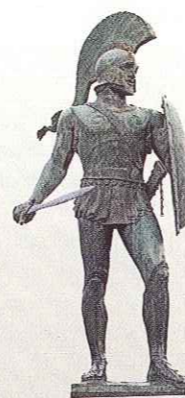
Leonidas był spartańskim królem, który panował w latach 490–480 p.n.e. Zapisał się w historii jako bohaterski dowódca obrony wawozu termopileńskiego podczas wojny z Persją.

? Dlaczego Leonidasa i Agesilaosa uznaje się za najbardziej znanych władców spartańskich?