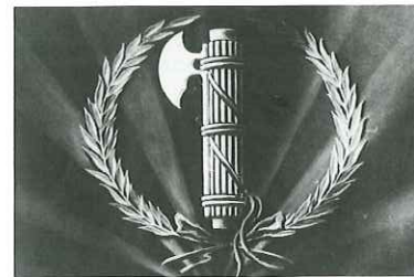
Wiązki różeg fascēs wraz z toporem stały się symbolem Włoch za rządów Mussoliniego. Można je było zobaczyć m.in. we włoskich kronikach filmowych.

Jednym z celów włoskiego ruchu faszystowskiego była budowa potęgi państwa włoskiego. Mussolini wzorował się przede wszystkim na tradycjach starożytnego Imperium Rzymskiego. Symbol władzy rzymskich urzędników – wiązka drewnianych różeg, nazywanych po łacinie fascēs – stała się znakiem ruchu faszystowskiego. Włoscy faszyci przejęli też od rzymskich legionistów charakterystyczny gest pozdrowienia – salut. Rozpowszechnił się on wśród organizacji skrajnie nacjonalistycznych w całej Europie, w tym również wśród niemieckich nazistów.