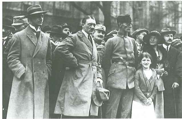
Adolf Hitler z działaczami NSDAP demonstrował w Monachium przeciwko działaniom podejmowanym przez władze w ramach walki z hiperinflacją. Przywódca nazistowskiej partii, chcąc zdobyć popularność wśród Niemców, organizował protesty dotyczące aktualnych problemów społecznych. W trakcie nieudanego puczu przekonał się jednak, że ma tylko nieznaczne poparcie.

Doskonale rozwijała się niemiecka kultura oraz sztuka – szczególnie architektura, kinematografia i literatura. Niemiecka szkoła architektoniczna Bauhaus