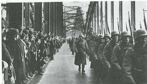
Zajęcie Nadrenii , będącej od 1919 r. strefą zdemilitaryzowaną, odbyło się 7 marca 1936 r. Mimo jawnego złamania przez Niemców traktatu wersalskiego działania te nie spotkały się z jakąkolwiek reakcją mocarstw zachodnich.

Równocześnie z działaniami wewnętrznymi Hitler prowadził agresywną politykę zagraniczną. Jego pierwszym celem w sprawach międzynarodowych było obalenie ograniczeń narzuconych Niemcom przez postanowienia przyjęte w Wersalu, a także odbudowanie potęgi Rzeszy. Francja i Anglia nie reagowały na to stanowczo, dlatego naziści stopniowo łamali zakazy traktatu wersalskiego. Wojsko niemieckie ponownie zaczęło stacjonować w Nadrenii, a Hitler rozpoczął zbrojenia na ogromną skalę.