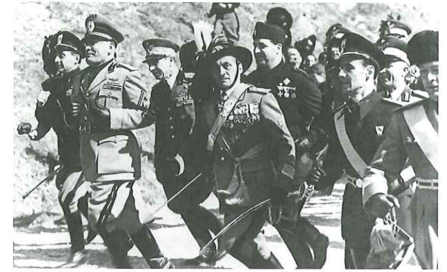
Mussolini postanowił się przebiec podczas spaceru, a towarzyszący mu oficerowie posłusznie ruszyli za nim biegiem. Duce chętnie fotografował się nie tylko w mundurze. Aby pokazać swoje zainteresowanie sytuacją włoskiego społeczeństwa, pozował również do zdjęć obok pracujących chłopów i robotników. Przy okazji prezentował swoją tężyznę fizyczną.

Ruch faszystowski kontynuował antykościelną politykę rządów włoskich, trwającą od momentu przyłączenia do Włoch Państwa Kościelnego. Zmieniło się to dopiero w 1929 r., kiedy Mussolini znormalizował stosunki z papieżem, zerwane wcześniej w 1870 r. Duce zawarł z papieżem Piusem XI pakt laterański, na mocy których powstało państwo Watykan.