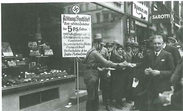
Rozdawanie ulotek oraz pikiety były częścią antysemickich demonstracji organizowanych przez nazistów. Działania te miały na celu zachęcić społeczeństwo niemieckie do bojkotowania sklepów żydowskich.

Był niemieckim politykiem, przywódcą nazistów – Führerem i kanclerzem III Rzeszy. W młodości interesował się malarstwem. Walczył na froncie I wojny światowej, podczas której został ranny w wyniku ataku gazowego. Od 1921 r. stał na czele NSDAP. Dwa lata później przeprowadził nieudany pucz w Monachium, za co został uwięziony. W tym czasie napisał książkę „Mein Kampf”, zawierającą program ruchu nazistowskiego. Po wyjściu z więzienia Hitler rozwijał struktury partii, której poparcie wzrosło podczas wielkiego kryzysu gospodarczego. W styczniu 1933 r. objął funkcję kanclerza Niemiec i wkrótce zdobył pełnię władzy. Na arenie międzynarodowej pozorował pokojowe zamiary, lecz równocześnie rozprawiał się z wewnętrzną opozycją w NSDAP, zakładał