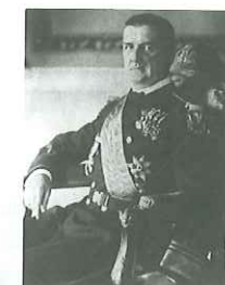
Admirał Miklós Horthy był regentem Królestwa Węgier. Po pokonaniu komunistów i likwidacji Węgierskiej Republiki Rad stanął na czele pierwszej w okresie międzywojennym prawicowej dyktatury.

Ideologia faszystowska i nazistowska znalazła swoich naśladowców w całej Europie. W latach 20. i 30. faszyzujące reżimy przejęły władzę w Hiszpanii, Portugalii i na Słowacji. Natomiast różnego typu rządy autorytarne, w których nadal funkcjonowała osłabiona opozycja, wprowadzono w Rumunii, na Węgrzech, w Bułgarii, Grecji, Jugosławii, państwach bałtyckich oraz Polsce.