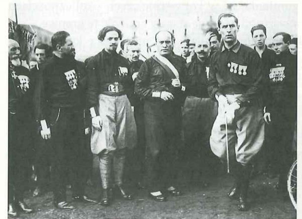
Mussolini wraz z przywódcami ruchu faszystowskiego zgromadził podczas marszu na Rzym kilkadziesiąt tysięcy zwolenników i z ich pomocą objął władzę we Włoszech.

Wytyczne polityki wewnętrznej streszczają się w wyrazach: oszczędność, praca, karność. Zagadnienie finansowe jest zasadnicze: trzeba dojść z możliwie największą szybkością do równowagi bilansu państwowego. System drobniogowej oszczędności, popieranie wszystkich sił produkcyjnych narodu, położenie kresu pozostałym obciążeniom wojennym.