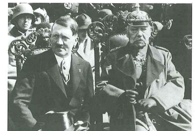
Adolf Hitler otrzymał od prezydenta Republiki Weimarskiej Paula von Hindenburga nominację na stanowisko kanclerza Niemiec. Wydarzenie to oznaczało przejście władzy przez nazistów.

Centrum Franza von Papena. Sądził on, że w utworzonym wielopartyjnym rządzie ugrupowania koalicyjne będą w stanie panować nad hitlerowcami. Jednak Hitler nie pozwolił sobą sterować i zaczął dążyć do przejścia pełni władzy. W lutym 1933 r., wykorzystując podpalenie gmachu parlamentu niemieckiego – Reichstagu – o które został posądzony komunista, przywódca nazistów doprowadził do delegalizacji swojego głównego przeciwnika – Komunistycznej Partii Niemiec. W kolejnych miesiącach systematycznie likwidował pozostałe ugrupowania polityczne i wkrótce Niemcy stały się państwem jednopartyjnym. W tej sytuacji Hitler postanowił ostatecznie zniszczyć opozycję. W czerwcu 1934 r., podczas tzw. nocy długich noży, rozprawił się krwawo ze sprzeciwiającym mu się kierownictwem SA, które żądało kontynuowania narodowosocjalistycznej rewolucji. Odtąd główną organizacją zbrojną nazistów było SS z Heinrichem Himmlerem na czele. W sierpniu 1934 r., po śmierci prezydenta Paula von Hindenburga, całą władzę w Niemczech objął Adolf Hitler.