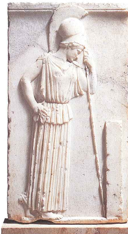
Zamyślona Atena z nieodłącznymi atrybutami: hełmem hoplity i włócznią. Ateńczycy wierzyli, że bogini ta dała im największy skarb – drzewo oliwne. Czcili ją jako patronkę swojego miasta.

Aby uspokoić nastroje społeczne, arystokratyczna elita zgodziła się na spisanie praw. Zadanie to powierzono w 621 r. p.n.e. Drakonowi . Nie wiemy dokładnie, jaki kształt nadał on zebranym przez siebie prawom, ponieważ później zastąpiono je innymi. Przetrwaly jedynie unormowania dotyczące zabójstw. Utrwaliło się przekonanie, że prawa Drakona były „pisane krwią”, czyli miały niezwykle surowy charakter (do dziś mówi się o „drakońskim” prawie).