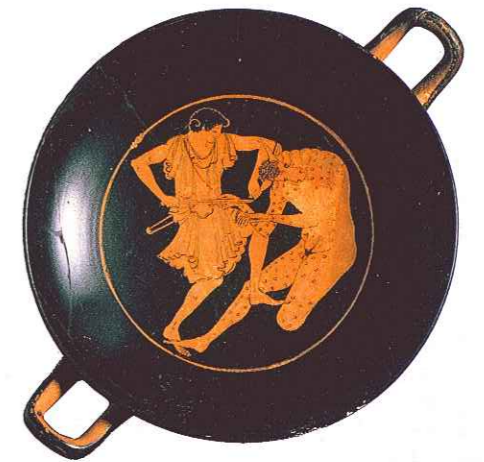
Tezeusz podczas zwycięskiej walki z Minotaurom – mieszkającym w kretańskim labiryncie pół człowiekiem, pół bykiem. Według mitologii Ateńczycy co roku byli zmuszeni wysłać Minotaurowi siedmiu chłopców i siedem dziewcząt na pożarcie. Z zamiarem zabicia Minotaura i uwolnienia ojczyzny od okrutnej ofiary wyprawił się do Knossos Tezeusz – królewicz ateński, syn Egeusza. Pokonał on Minotaura i dzięki zakochanej w nim córce Minosa, Ariadnie, która podarowała mu kłębek nici, wydostał się z labiryntu. Związał nic przywiązaną przy wejściu i w ten sposób zdołał opuścić budowlę.

Ateńczycy wierzyli, że demokrację stworzył legendarny król Tezeusz lub wybitny prawodawca Solon. W rzeczywistości punktem zwrotnym w historii ustroju Aten było przeprowadzenie u schyłku VI w. p.n.e. reformy Klejstenesa. Za główne zasady systemu demokratycznego uznano wolność oraz równość. Wolność w sferze publicznej rozumiano jako prawo do uczestnictwa w życiu politycznym lub rezygnacji z niego, w sferze prywatnej zaś – jako możliwość życia według własnego upodobania. Obowiązywała równość wobec prawa, a obywatele mieli takie same szanse na sprawowanie władzy. Mogli także brać udział w obradach zgromadzenia ludowego (eklezji) – najważniejszej instytucji w polis . Jego decyzje były podejmowane publicznie. Każdy z uczestników miał prawo udziału w jawnym lub tajnym głosowaniu. Podczas obrad trzeba było przekonać przybyłych do swoich racji, aby uzyskać ich poparcie. W związku z tym dużego znaczenia nabrała sztuka wymowy, czyli retoryka , umożliwiająca stosowanie manipulacji. Posiedzenia zgromadzenia ludowego odbywały się cztery razy w miesiącu, zwykle na Pnyksie . Rozpoczynano je o świcie, a kończono