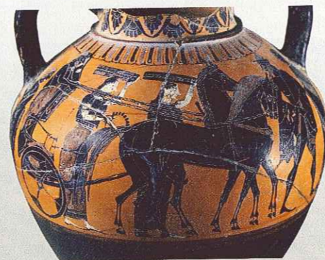
Uroczysty przejazd orszaku weselnego do domu pana młodego był jednym z tematów greckiego malarstwa wazowego. Oprócz wozu, na którym jedzie panna młoda, na wozie namalowano również kobiety niosące przedmioty składające się na posąg.

Grecy wcześniej zawierali małżeństwa: kobiety w wieku mniej więcej 14 lat, a mężczyźni – 18. Związek zawierano z inicjatywą mężczyzny, który zwracał się do ojca lub – w razie jego braku – opiekuna wybranki z propozycją zaślubin. Przed zaręczynami ustalano wartość posagu. Ślub miał uroczysty charakter. Panna młoda zakładała wspaniałe szaty, ofiarowywała bogom swoje zabawki z dzieciństwa oraz pukiel włosów. Jej dom przystrajano kwiatami. Po uroczystej zorganizowanej przez ojca oblubienicy orszak weselny udawał się do domu jej męża. Pan młody przynosił żonę przez próg, a potem zaczynała się kolejna uczta, podczas której para otrzymywała prezenty.