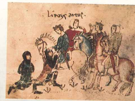
Hold lenny był mocno zakorzeniony w tradycji średniowiecznej. Przedstawiony na miniaturze legendarny król Artur przyjmuje ofertę służby od rycerzy Esklabora i Arfasara.

Aktowi komedacji, czyli oddania się wolnej osoby (wasala) pod opiekę innego wolnego człowieka (seniora), zapewniono w średniowieczu niezwykle uroczystą oprawę. Podczas ceremonii, która towarzyszyła komedacji, wasal klękał przed seniorem, wkładał swoje złożone dłonie w jego dłonie i składał przysięgę wierności. Następnie senior podnosił wasala, całował go w usta na znak pokoju oraz przekazywał mu lenno, nazywane inwestyturą. Zazwyczaj wręczał mu przy tym przedmiot stanowiący symbol nadania – sztandar, włócznię, lancę lub dokument – oraz bryłkę ziemi. W efekcie złożenia holdu tworzyła się silna więź osobista między przyjmującym hold seniorem a oddającym się pod jego opiekę wasalem.