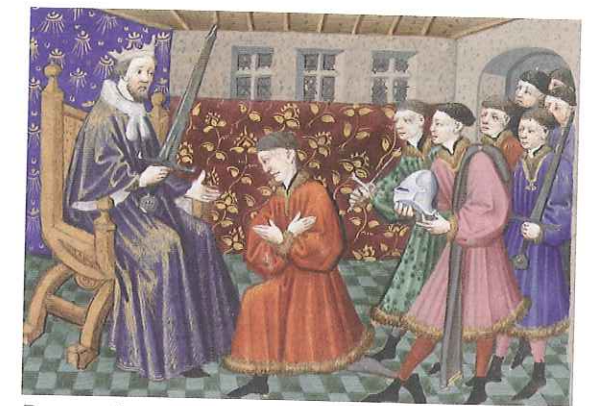
Pasowanie na rycerza to ceremonia, której nazwa pochodzi od jednego z wręczanych w jej trakcie atrybutów – pasa (drugim był miecz). Z biegiem czasu towarzyszące tej uroczystości rytuały stawały się bardziej złożone.

Odmienny system lenny ukształtował się w Anglii. Po przejęciu tamtejszego tronu Wilhelm Zdobywca, w obawie przed nadmiernym wzrostem pozycji możnowładców, rozdawał im ziemie rozrzucone po całym kraju. Takie rozproszenie dóbr skutecznie uniemożliwiało wasalom podejmowanie prób uniezależnienia się od suzerena. Ponadto zanim wasal złożył przysięgę wierności swojemu seniorowi, musiał zobowiązać się do lojalności wobec króla. W ten sposób władca starał się zapewnić jedność kraju. Ten cel miała realizować również administracja państwowa. Silną pozycję w Anglii zajmowali szeryfowie – urzędnicy monarchy odpowiadający za bezpieczeństwo w państwie.