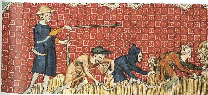
Chłopi podczas żniw na polu pana feudalnego, nadzorowani przez nadzorcę, zajmującego się organizacją ich pracy. Do zbioru zbóż używano wówczas żelaznych sierpów, za pomocą których ścinano jedynie kłosy.

We wczesnym średniowieczu decydujące znaczenie dla rozwoju władztwa gruntowego miało upowszechnienie się immunitetu . Dzięki niemu wielka własność ziemska ostatecznie przeobraziła się we własność senioralną, w której obowiązywały połączone zasady prawa publicznego i prywatnego. Doprowadziło to do zatarcia różnic między ludnością niewolną a wolnymi dzierżawcami. Powstała jednolita warstwa poddanych, niemających wolności osobistej i pełnych praw do ziemi. Podlegali oni sądownictwu właścicieli ziemskich, a za użytkowane grunty uiszczali renty feudalne. Najczęściej wykonywali prace rolne na pańskich gruntach ( pańszczyznę ), świadczyli usługi transportowe albo rzemieślnicze czy też oddawali część płodów rolnych. Dopiero później upowszechniły się także renty pieniężne.