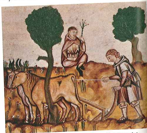
Orka pola za pomocą zaprzęgu wołów przedstawiona na średniowiecznej miniaturze. Przełomem w uprawie roli w średniowieczu było pojawienie się na początku VIII w. we Francji żelaznych plugów.

W świecie podzielonym między zwalczające się monarchie barbarzyńskie niemal całkowicie zamarły handel oraz obrót pieniężny, a wraz z nimi produkcja rzemieślnicza. Upadł także handel dalekosiężny w basenie Morza Śródziemnego. Po rzymskich drogach już podróżowali kupcy, zapewniający miastom zaopatrzenie. Życie toczyło się przede wszystkim w niewielkich, odizolowanych od siebie wspólnotach wiejskich. Gospodarka towarowo-pieniężna została wyparta przez gospodarkę naturalną , zredukowaną do