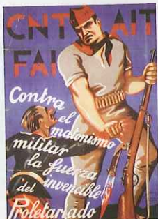
Plakat propagandowy anarchistów z okresu wojny domowej w Hiszpanii wzywał do walki ze zbuntowanymi wojskami generała Franco.

kolonialnego. Po drugiej stronie znalazł się zaś radykalny ruch robotniczy popierany przez związki zawodowe zrzeszające miliony Hiszpanów. Mieli oni poglądy antyklerykalne i planowali przeprowadzić radykalne reformy społeczne. Po stronie republikanów opowiedzieli się także baskijscy i katalońscy separatyści domagający się niezależności dla swoich narodów. Zarówno anarchiści, jak i frankiści dopuszczali się licznych okrucieństw wobec swoich przeciwników.