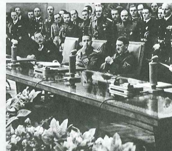
Zawarcie paktu trzech przez Japonię, Niemcy i Włochy we wrześniu 1940 r. było przypieczętowaniem wszystkich wcześniejszych porozumień kształtujących powstanie osi.

W 1936 r. Włochy i Niemcy zawarły sojusz, który Benito Mussolini określił jako „oś współpracy”. Równocześnie Hitler, głoszący ideę walki z komunizmem, podpisał w tym samym roku pakt antykominternowski z Japonią. Oficjalnie sojusz ten był wymierzony w „międzynarodowy komunizm”, jednak w rzeczywistości miał stanowić podstawę współpracy w kwestii podboju innych krajów oraz podziału ich na strefy wpływu. Rok później do układu tego przyłączyły się Włochy. Powstała wówczas tzw. oś Berlin–Rzym–Tokio, dlatego odtąd kraje sprzymierzone z Niemcami nazywano państwami osi.