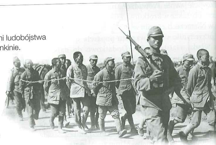
Chińscy jeńcy wzięci do niewoli przez Japończyków byli często mordowani w brutalny sposób.

Podczas wojny w Chinach do największej zbrodni ludobójstwa popełnionej przez wojska japońskie doszło w Nankinie. Na przełomie 1937 i 1938 r. Japończycy w bestialski sposób przez sześć tygodni bezkarnie mordowali cywilów. Żołnierze stosowali najokrutniejsze metody – zasypywali mieszkańców miasta żywcem, organizowali barbarzyńskie zawody w ścinaniu głów samurajskim mieczem oraz ćwiczenia pchnięć bagnetem. Szacuje się, że w Nankinie zginęło ok. 300 tys. Chińczyków. W 1937 r. podobnego bestialstwa Japończycy dopuścili się również w Szanghaju, gdzie wymordowali ponad 200 tys. ludzi.