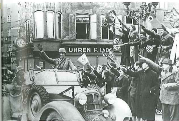
Vjeżdżające do Wiednia oddziały niemieckie spotkały się entuzjazmem zdecydowanej większości Austriaków.

W marcu 1938 r. Hitler zażądał podania się do dyskusji austriackiego kanclerza Kurta von Schuschnigg. Władzę przejęli wówczas austriaccy faszyci, dążący do zjednoczenia ich kraju z Niemcami. Na czele rządu stanął Arthur Seyss-Inquart , który zwrócił się do Niemiec z prośbą o przysłanie wojsk, a gdy 12 marca 1938 wkroczyły one do Austrii, ogłosił przyłączenie (nieoficjalnie Anschluss ) swojego kraju do III Rzeszy. Pierwszy etap ekspansji został zatem przeprowadzony bezkrwawo, a większość społeczeństwa austriackiego poparła rezygnację z niepodległości. Kraj został przemianowany