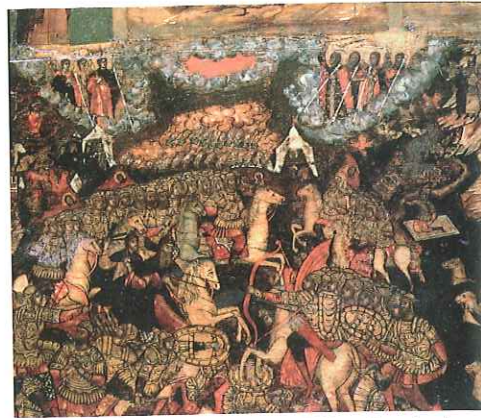
Bitwa na Kulikowym Polu z 1380 r. okazała się przełomem w trwających ponad dwa stulecia okrutnych rządach mongolskich na Rusi. Rozbicie armii Złotej Ordy przez wojska moskiewskie zapoczątkowało stopniowe uwalnianie się Rusi spod panowania mongolskiego.

Równocześnie z inwazją na Węgry część wojsk mongolskich uderzyła na Polskę. Prawdopodobnie cel najeźdźców stanowiła jedynie dywersja – zamierzali w ten sposób uniemożliwić