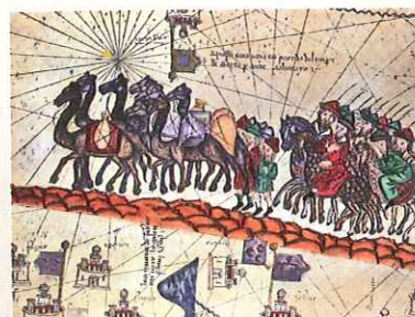
Marco Polo w drodze do Chin podążał wzdłuż jedwabnego szlaku – drogi handlowej łączącej Europę z Bliskim i Dalekim Wschodem.

❓ Odszukaj w różnych źródłach informacje o tym, dlaczego niektórzy badacze wątpią w autentyczność podróży Marca Polo do Chin.