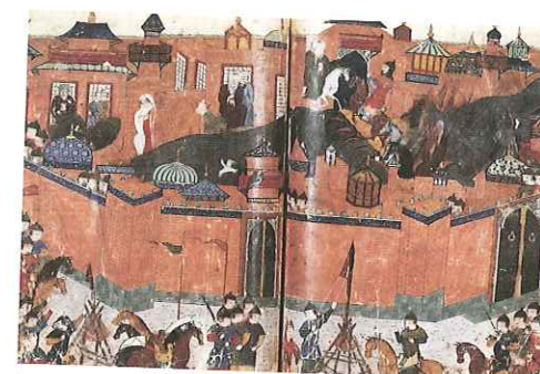
Zdobycie Bagdadu przez Mongołów zakończyło się rzezią mieszkańców miasta. W jednym z zachowanych źródeł napisano o 400 tys. ofiar, jednak należy pamiętać, że liczby podawane w średniowiecznych kronikach często nie są zgodne z prawdą – kronikarze w zależności od potrzeby zawyżali lub zaniżali dane.

W 1234 r. Mongołowie po raz kolejny najechali północne Chiny. Mimo heroicznej obrony państwo dynastii Jin przestało istnieć. Kampanie wojenne na tych terenach, prowadzone przez wielkich chanów z dużym zaangażowaniem, trwały z przerwami aż do 1279 r. , kiedy to zginął ostatni potomek władającej południowymi Chinami dynastii Song. Całe terytorium chińskie, a także tytuł cesarza zdobył wnuk Czyngis-chana, Kubilaj . Przeniósł on stolicę swojego imperium do Pekinu i zapoczątkował panowanie dynastii Yuan. Zarówno władca, jak i elity państwowe w krótkim czasie uległy procesowi sinizacji . Ustaliły się również granice imperium mongolskiego na Dalekim Wschodzie. Jego zwierzchność uznała Korea, odrzuciła ją natomiast Japonia.