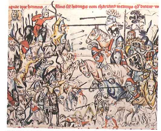
Bitwa pod Legnicą zakończyła się druzgocącą klęską rycerstwa polskiego. Do mongolskiej niewoli trafił wówczas dowódca koalicji wojsk chrześcijańskich, Henryk Pobożny. Książę po walce nie chciał oddać honorów zwłokom jednego z poległych wodzów mongolskich, za co został ścięty.

przybycie z odsieczą zagrożonym Węgom. Koczownicy zdobyli i zniszczyli Sandomierz oraz opuszczony przez mieszkańców Kraków. Rycerstwo małopolskie stawiło im czoło pod Chmielnikiem, jednak zostało rozbite. Posuwając się na zachód, siły mongolskie dotarły na Śląsk. Do rozstrzygającej bitwy doszło 9 kwietnia 1241 r. pod Legnicą . Polacy pod wodzą Henryka Pobożnego po zaciętej walce ponieśli klęskę, a sam książę zginął. Zwycięskie wojska mongolskie ograbiły ziemie polskie, a następnie wycofały się na południe i dołączyły do sił głównych. W kolejnych latach chanowie nie zmobilizowali już armii przeciw Polsce. Późniejsze najazdy na jej ziemię, w 1259 i 1287 r., miały charakter wyłącznie łupieżczy – Tatarzy pustoszyli polskie terytoria, grabili je, uprowadzali jeńców (brali ich w jasyr), a następnie wycofywali się do swoich siedzib.