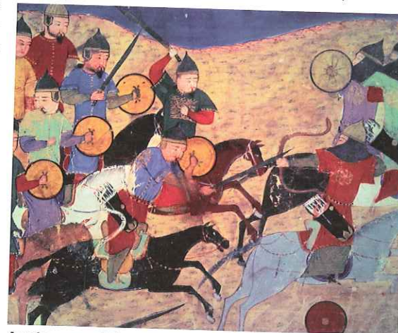
Armia mongolska wzbudzała grozę w krajach Azji i Europy. Państwa, które stały się celem ekspansji mongolskiej – z wyjątkiem leżącej na wyspach Japonii oraz rządzonego przez mameluków Egiptu – nie były w stanie oprzeć się potęgze Mongołów.

W czasie tych kampanii wydzielona część wojsk mongolskich przeprowadziła trwający kilka lat rajd na obszary Europy Wschodniej. Miał on charakter wyłącznie łupieżczy, dywersyjny oraz rozpoznawczy. Mongołowie wtargnęli do Gruzji, rozbili tamtejsze wojska