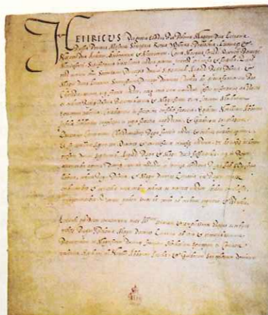
Pacta conventa Henryka Walezego zobowiązywały władcę m.in. do spłaty długów po Zigmuncie Auguście oraz poślubienia siostry zmarłego króla, 50-letniej wówczas Anny.

? Wymień różnice między Artykułami henrykowskimi a pacta conventa .