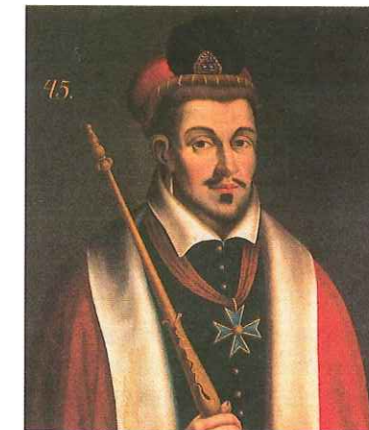
Henryk Walezy słynął z zamilowania do wykwintnych strojów i koronek. Na polskim dworze szczególnie szokowały noszone przez niego kolczyki.

Z czasem obóz antyhabsburski coraz chętniej popierał kandydaturę Henryka Walezjusza , brata francuskiego króla Karola IX. Władający Francją Walezjusze byli naturalnymi przeciwnikami Habsburgów. Henryk, choć pierwszy w kolejności do francuskiego tronu, mógłby nigdy na nim nie zasiąść, gdyby jego bratu urodziło się potomstwo. Zatem inaczej niż król Szwecji czy moskiewski car władałby tylko Rzeczpospolitą, rezydowałby w kraju i nie byłby ograniczony polityką swojego królestwa. Obawy szlachty budziły jednak ciężące na Walezjuszu podejrzania o udział w organizacji rzezi hugenotów – tzw. nocy św. Bartłomieja w 1572 r.