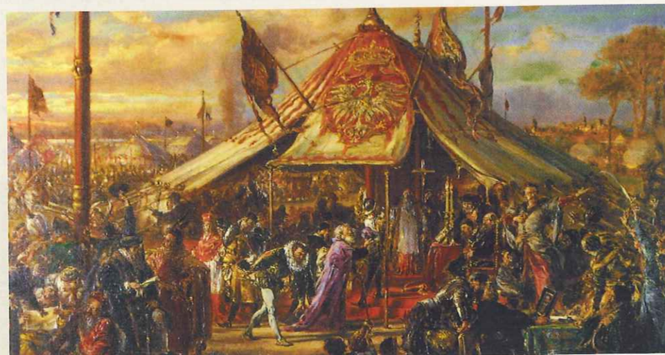
Potęga Rzeczypospolitej u zenitu. Złota wolność. Elekcja. R.P. 1573 to obraz Jana Matejki, na którym malarz przedstawił scenę z wyboru Henryka Walezego.

Od 1572 r. lokalne konfederacje, zwane kapturami, stały się elementem każdego bezkrólewia. Wkrótce wykształciły się także konfederacje generalne – obejmujące cały kraj. Na czele takiej konfederacji stała rada generalna, której przewodził wybierany marszałek. W XVII w. w czasie walk politycznych z królem konfederaci powoływali swoją armię.