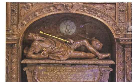
Nagrobek Zygmunta Augusta znajduje się w centralnym miejscu kaplicy Zyguntowskiej w katedrze krakowskiej.

Zwołany do Warszawy na początku 1573 r. sejm konwokacyjny ostatecznie rozwiązał spór kompetencyjny między prymasem a marszałkiem wielkim koronnym – pierwszy miał być interrexem, przewodniczyć elekcji nowego króla i go koronować, rola drugiego ograniczała się do publicznego