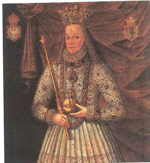
Anna Jagiellonka w stroju koronacyjnym została przedstawiona na obrazie Marcina Kobera. Po śmierci brata, Zygmunta Augusta, była ostatnią przedstawicielką dynastii Jagiellonów.

W grudniu 1575 r. doszło do podwójnej elekcji. Prymas Uchański bez porozumienia ze szlachtą ogłosił królem Maksymiliana II . Wywołało to ogromne oburzenie wśród wyborców zebranych na polach elekcyjnych. Ostatecznie nie uzgodniono jednak wspólnego kandydata do tronu. W tej sytuacji Jan Zamojski wysunął pomysł powołania na tron Anny Jagiellonki i związania jej małżeństwem ze Stefanem Batorem , co wywołało powszechną euforię wśród szlachty, przy zachowującej rezerwę magnaterii. Bardziej aktywni okazali się zwolennicy Jagiellonki i Batorego, którzy opanowali Kraków i czekali na przybycie księcia siedmiogrodzkiego do Polski. Już w lutym 1576 r. na Węgrzech Batory zaprzysiął Artykuły henrykowskie i pacta conventa , a w kwietniu dotarł do Krakowa, gdzie szybko odbył się jego ślub z Anną Jagiellonką i koronacja na króla. Maksymilian II nie zdecydował się na walkę o koronę i wkrótce zmarł.