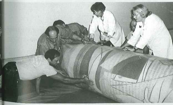
Przygotowanie „Guerniki” do transportu z Nowego Jorku do Madrytu było bardzo pracochłonne i wymagało dużej ostrożności.