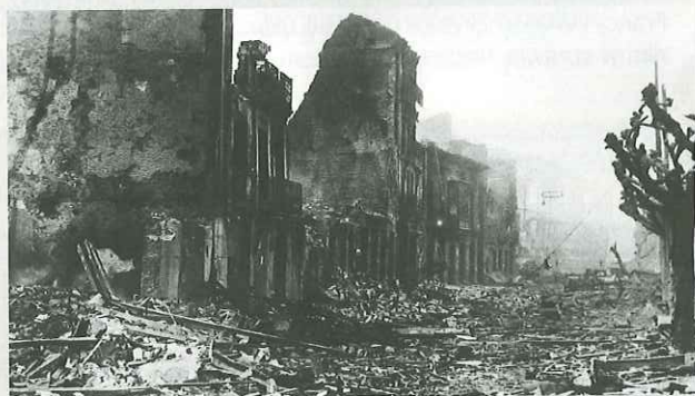
Guernica, niewielka miejscowość baskijska, podczas bombardowania przez niemiecki Legion Condor została prawie całkowicie zniszczona.

Według jednej z anegdot do paryskiej pracowni Piwala o podjęciu przez jego kraj decyzji o inwazji na Irak. Picassa podczas hitlerowskiej okupacji przyszli agenci Gestapo. Jeden z oficerów, rozglądając się po pomieszczeniu, dostrzegł fotografię „Guerniki” i zapytał malarza: Czy to pańskie dzieło? Nie, wasze. – odparł na to artysta.