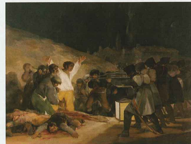
„Rozstrzelanie powstańców madryckich” to obraz Francisca Goi, do którego Pablo Picasso nawiązał podczas tworzenia „Guerniki”.