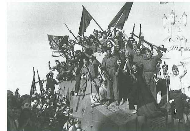
Hiszpańscy anarchiści wiwatują z okazji pokonania oddziałów frankistowskich w Barcelonie. Anarchiści obok socjalistów stanowili na początku wojny domowej główną część sił republikańskich.