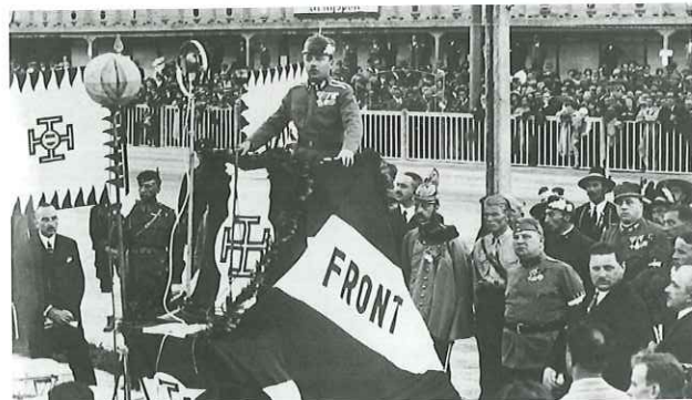
Kancelarz Austrii Engelbert Dollfuss przemawia do wiedeńczyków. Objął on władzę w Austrii w sposób demokratyczny w 1933 r., a po krótkim czasie rozwiązał parlament i wprowadził rządy autorytarne. Mimo że głosił poglądy wzorowane na włoskim faszyzmie, walczył z austriackimi nazistami dążącymi do połączenia Austrii z hitlerowskimi Niemcami. Zginął z rąk nazistów podczas nieudanego puczu w 1934 r.