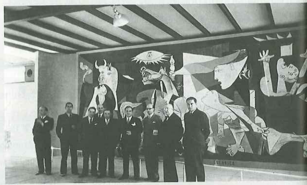
Przedstawiciele hiszpańskich władz republikańskich pozują do zdjęcia podczas wystawy światowej w Paryżu.