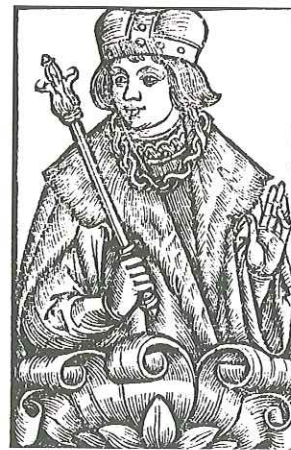
Władysław II Wygnaniec jako princeps miał początkowo silną pozycję polityczną w podzielonej na dzielnice Polsce. Dzięki małżeństwu z Agnieszką, córką margrabiego austriackiego, zyskał poparcie najpotężniejszych rodów Rzeszy Niemieckiej. ■ drzeworyt, Polska, XII w.

W swoim testamencie Krzywousty wyznaczył dzielnicę senioralną, która najprawdopodobniej składała się z Małopolski (ze stołecznym Krakowem) oraz ziem sieradzkiej i łęczyckiej. Do księcia seniora należała także władza zwierzchnia nad Pomorzem. Położona centralnie dzielnica senioralna miała zapewnić skuteczne rządy kolejnym seniorom. Była niepodzielna i nie podlegała dziedziczeniu. Seniorzy mieli przejmować ją jedynie na czas sprawowania władzy zwierzchniej. Trzem pełnoletnim synom Krzywousty nadał odrębne dzielnice. Najstarszy z nich, pierwszy senior – Władysław , nazwany później „ Wygnanec ”, otrzymał Śląsk, Bolesław Kędzierzawy – Mazowsze, a Mieszko Stary – zachodnią część Wielkopolski z Poznaniem. Czwartemu z braci, Henrykowi , który był jeszcze dzieckiem, ojciec zapisał ziemię sandomierską, stąd jego późniejszy przydomek: „ Sandomierski ”. Henryk otrzymał ją później i być może – jak uważają niektórzy historycy – tylko dożywotnio, na mocy decyzji braci. W testamencie nie został wzięty pod uwagę ostatni syn Bolesława, Kazimierz Sprawiedliwy , który urodził