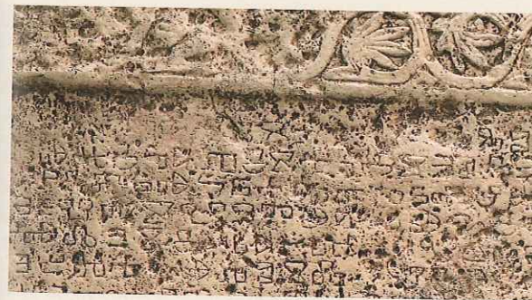
Płyta z Baški pochodzi z 1100 r. i jest jednym z najstarszych zabytków zapisanych chorwackim piśmem glagolickim. Treść inskrypcji dotyczy darowizny króla Chorwacji dla opata kościoła św. Łucji z wyspy Krk. Płytę znaleziono w osadzie Baška – stąd jej dzisiejsza nazwa.

Po śmierci Cyryla Metodego, który został arcybiskupem Moraw oraz innych krajów słowiańskich, kontynuował misję samodzielnie. W Rzymie zwyciężyło wówczas przekonanie, że tylko używanie łaciny gwarantuje trwałość i jednolitość doktryny Kościoła. Dlatego po śmierci Metodego jego metropolia została zlikwidowana. Uczniowie braci znaleźli schronienie w Bułgarii i Dalmacji. W następnych wiekach obrządek słowiański przyjęto w państwach chrystianizowanych za pośrednictwem Bizancjum: w Bułgarii, Serbii oraz na Rusi. Uczniowie Cyryla i Metodego udoskonaliли alfabet słowiański. Na cześć swojego nauczyciela nazwali go cyrylicą. Cyryl i Metodego zostali uznani za świętych przez Kościół katolicki oraz prawosławny. Ze względu na wkład w chrystianizację Słowiańszczyzny nazywa się ich „apostolami Słowian”.