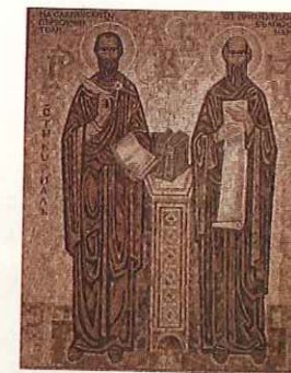
Cyryl i Metodego w 1980 r. zostali ogłoszeni przez papieża Jana Pawła II współpatronami Europy. W ikonografii są oni przedstawiani jako biskupi greccy lub łacińscy, a ich atrybutami są krzyż, księga i kielich oraz rozwinięty zwój z alfabetem łacińskim.

? Jakie były reakcje Słowian na działalność Cyryla i Metodego?