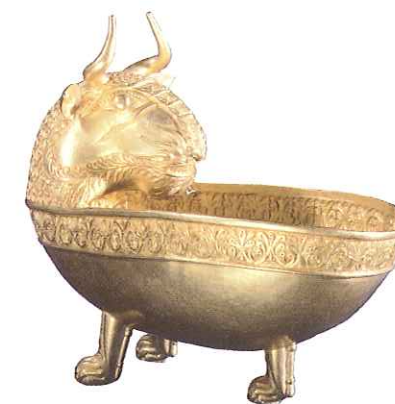
„Skarb Attyli” to nazwa nadana kosztownościom odnalezionym w XIX w. Wśród nich znajdują się liczne wyroby kultury awarskiej. Ten bogaty zbiór zawiera głównie biżuterię oraz złote naczynia. Przedstawiona na zdjęciu czasza, pochodząca ze skarbu, została ozdobiona m.in. motywem głowy zwierzęcia.

Na wczesne dzieje Słowiańszczyzny duży wpływ wywarli Awarowie . Był to koczowniczy lud pochodzenia tureckiego, który wtargnął do Europy w drugiej połowie VI w. i utworzył w Panonii państwo rządzone przez chana – kaganat awarski . Awarowie napadali na pograniczne tereny cesarstwa bizantyjskiego oraz monarchii frankijskiej. Przewagę militarną zapewniała im doskonała ciężkozbrojna jazda, używająca nieznanych wówczas w Europie strzemion. Umożliwiały one lepsze utrzymanie się w siodle, dzięki czemu jeździec mógł o wiele sprawniej prowadzić walkę. Udział w tych wyprawach brali także wojownicy słowiańscy z plemion podporządkowanych Awarom. Kaganat zapewniał