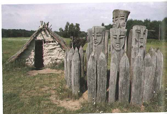
Replika typowego wielkomorawskiego domu na terenie wczesnośredniowiecznego grodu w miejscowości Póhárisko. Na obszarze tym odkryto prawie 1500 różnych obiektów, datowanych na VI–VIII w.

W 831 r. Mojmir I przyjął chrzest i zaczął tworzyć podstawy organizacji kościelnej. Ufundował na terenie swojego państwa pierwsze kamienne kościoły, sprowadził księży. Parafie wielkomorawskie podlegały jednak diecezjom niemieckim, skąd pochodziła też większość duchownych. Stwarzało to zagrożenie narzucenia państwu wielkomorawskiemu zwierzchności politycznej przez królów wschodniofrankijskich. Dlatego następcy Mojmira I dążyli do utworzenia własnej