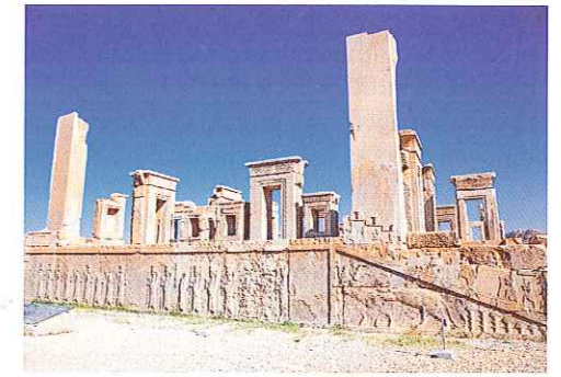
Persepolis zostało zajęte przez oddziały Aleksandra Wielkiego w 330 r. p.n.e. Wraz z miastem w ręce zdobywców wpadły wielkie skarby zgromadzone tam przez władców perskich. Najeźdźcy, będąc pod wpływem alkoholu, spalili pałac Dariusza i Kserksesa. Rzekomym usprawiedliwieniem miał być odwet za zniszczenie przez Persów półtora wieku wcześniej greckich świątyń.

W 330 r. p.n.e. władca Macedonii zajął, a następnie splądrował i spalił Persepolis . Zdobywanie wschodnich satrapii imperium Persów trwało do 327 r. p.n.e. Aleksander nie planował jednak zakończenia na tym swoich podbojów. Uderzył na Indie – kraj, jak mu się wydawało,