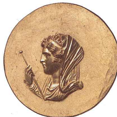
■ plakietka ze złota, Grecja, III w. p.n.e.

Olimpias , córka króla Epiru, była jedną z kilku żon Filipa II. Jej stosunki z mężem nie układały się dobrze – zwłaszcza od czasu, gdy ożenił się on ponownie, tym razem z 18-letnią dziewczyną. Olimpias za wszelką cenę starała się zapewnić następstwo tronu swojemu synowi, Aleksandrowi. Odgrywała ważną rolę polityczną zarówno za życia Aleksandra, jak i po jego śmierci.