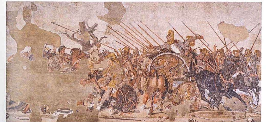
Bitwa pod Issos została uwieczniona na mozaice w Pompejach. Dramatyczna scena natarcia Aleksandra Wielkiego i panicznej ucieczki Dariusza III prawdopodobnie stanowi kopię znacznie starszego malowidła z czasów hellenistycznych. W centrum sceny widać Dariusza na rydwaniu, a z lewej strony – Aleksandra. Nie ma całkowitej pewności, czy rzeczywiście jest to obraz bitwy pod Issos. Być może autor przedstawił starcie pod Gaugamelą lub syntezę wszystkich bitew Aleksandra. Jedyne szczególne ważne z punktu widzenia topografii stanowić może uschnięte drzewo. W sensie dosłownym może wskazywać na Gaugamelę, ponieważ wojska walczyły tam na specjalnie przygotowanej otwartej przestrzeni. W sensie symbolicznym uschnięte drzewo zapowiada rychły kres władcy.