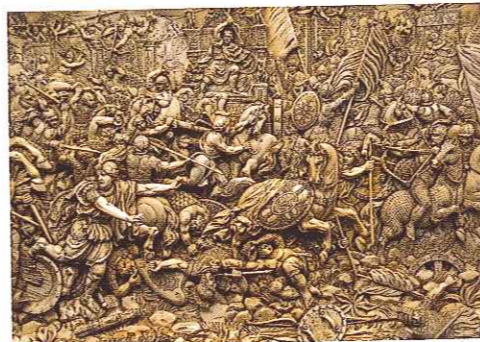
Bitwa pod Gaugamelą została stoczona 1 października 331 r. p.n.e. Pole walki położone na równinie wybrał król Persów. Odpowiadało ono jego armii, składającej się w większości z konnicy. Jednak Aleksander Wielki zastosował tzw. szyk skośny, dzięki czemu pokonał Persów.

Aleksander rozpoczął panowanie od krwawej rozprawy z tymi, którzy mogli zagrozić jego władzy. Następnie stłumił bunt Tebańczyków. Zburzył Teby, a ich mieszkańców sprzedał do niewoli. Miało to być ostrzeżenie dla całej Grecji. Aleksander zamierzał wprowadzić w życie ojcowskie plany wojny z Persją. Zaatakował ją w 334 r. p.n.e., aby – jak twierdził – ukarać Persów za ich najazd na Grecję z początku V w. p.n.e. W pierwszym znaczącym starciu nad rzeką Granikos (334 r. p.n.e.) rozgromił wojska perskich satrapów, co otworzyło mu drogę w głąb Azji Mniejszej. Na zajętych terenach występował w roli wyzwoliciela Greków i zapewne za niego się uważał. Niejako przy okazji z pomocą wyzwolonych Greków przygotowywał sobie bezpieczne zaplecze dla dalszych operacji. Do walnego starcia z wojskami perskimi pod dowództwem króla Dariusza III doszło w 333 r. p.n.e. pod Issos w Cylicji. Bitwa zakończyła się zwycięstwem Aleksandra. Armia Dariusza została rozbita, sam władca Persji zaś musiał ratować się ucieczką. W ręce Aleksandra wpadły bogate łupy, a także cały obóz perski, w którym przebywały matka i żona Dariusza.