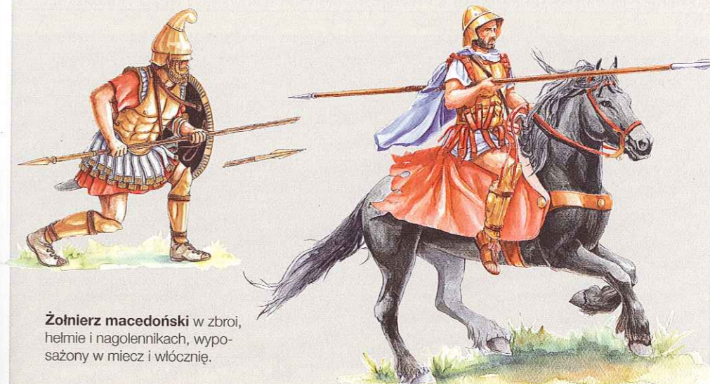
Żołnierz macedoński w zbroi, hełmie i nagołennikach, wyposażony w miecz i włócznie.