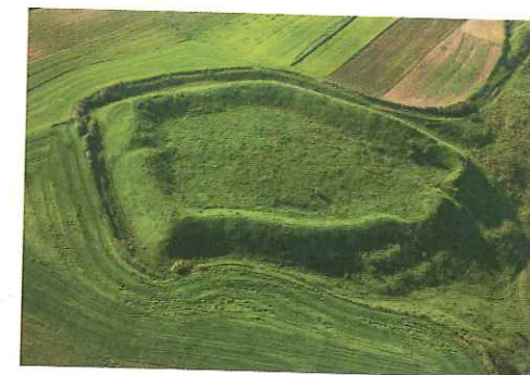
Słowiańskie grodzisko w Stradowie datowane jest na okres między VIII a IX w. Wraz z podgrodziami zajmowało ono obszar niemal 25 ha i było jednym z największych w kraju. W czasach plemiennych stanowiło prawdopodobnie ważny ośrodek państwa Wiślan.