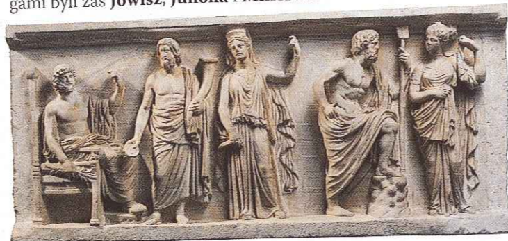
Jowisz (Jupiter), Dis Pater (gr. Pluton), Prozerpina (gr. Persefona), Neptun i Amfitryta stanowiły tylko niewielką część liczego panteonu bogów świata grecko-rzymskiego.

W pierwotnej religii rzymskiej występowało wiele bóstw. Sprawowały one pieczę nad poszczególnymi zjawiskami i czynnościami związanymi z uprawą roli. Każdy człowiek miał też własne bóstwo opiekuńcze, zwane geniuszem . Z czasem utrwaliło się przekonanie, że wszystko – nawet konkretne miejsce – ma swojego geniusza (łac. genius loci – ‘geniusz miejsca’). Ważną rolę odgrywały również bóstwa domowe. Rzymianie wierzyli w lary i penaty, opiekujące się domami oraz spiżarniami, a także w należące do świata zmarłych many. Nad rzymskimi gospodarstwami czuwała Westa , a nad granicami posiadłości – Terminus . Część bóstw domowych weszła później do ogólnego panteonu. Wyjątkowe znaczenie zyskała Westa, której kapłanki, zwane westalkami, czuwały nad świętym ogniem ( civitas ). Najważniejszymi rzymskimi bogami byli zaś Jowisz , Junona i Minerwa .