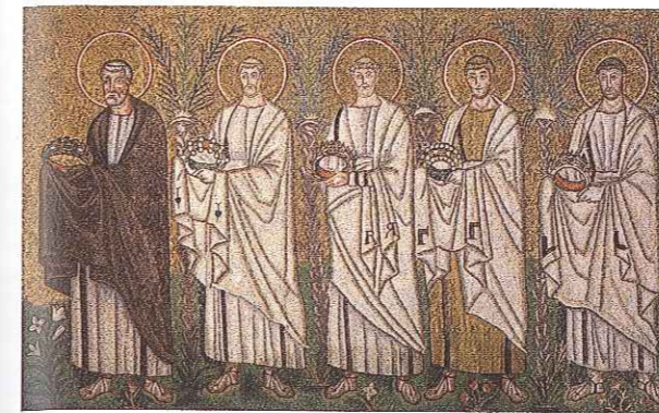
Procesja męczenników została uwieczniona na ścianach baptysterium, czyli budowli, w której odbywały się chrzty. Palmy widoczne pomiędzy postaciami wskazują, że święci oddali życie za wiarę.