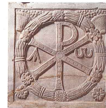
Chrystopogram był symbolem pierwszych chrześcijan. Składał się ze znaków „X” i „P”. Pierwszy z nich nawiązywał do greckiej litery „ch” ( chi ), drugi – do „r” ( rho ), obydwa zaś razem – do pierwszych liter imienia Chrystos, czyli (Jezus) Chrystus.

Dzięki opiece państwa Kościół rósł w siłę. Hojne ofiary cesarzy, którzy dla zyskania życzliwości i wsparcia kościelnych hierarchów przyznawali mu wielkie majątki, uczyniły go potęgą ekonomiczną. Chrześcijańskie wspólnoty rozrosły się w wielkie diecezje , kierowane przez biskupów oraz podległych im kapłanów. Szczególnie ważną rolę odgrywało pięciu patriarchów . Ich siedzibami w V w. n.e. były: Rzym, Antiochia, Jerozolima, Aleksandria oraz Konstantynopol. Zbiorową wolę Kościoła wyrażały lokalne synody biskupów danego obszaru oraz sobory, czyli powszechne zgromadzenia wszystkich biskupów. Najważniejsze miejsce zajmował biskup Rzymu , tradycyjnie uważany za następcę św. Piotra.