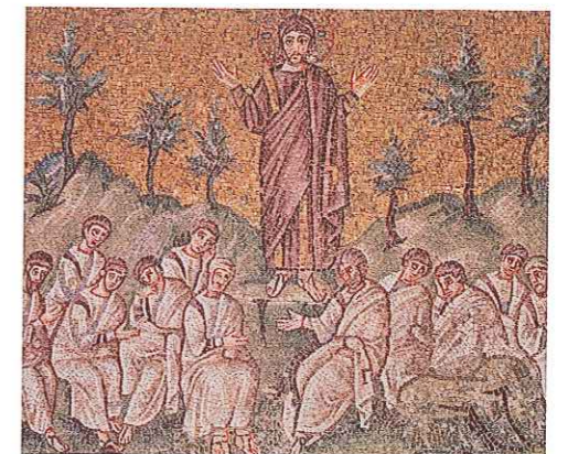
Kazanie na górze według Ewangelii Chrystus miał wygłosić do zgromadzonych tłumów wiernych na Górze Błogosławieństw w pobliżu jeziora Genezaret.

Nowa wiara początkowo zyskiwała wyznawców wyłącznie wśród Żydów. Docierała nawet do odległych zakątków Imperium Rzymskiego, gdzie funkcjonowały gminy żydowskie. Upowszechnianie chrześcijaństwa wśród innych ludów rozpoczęła działalność św. Pawła . Zdołał on przekonać apostołów do ograniczenia wywodzących się z judaizmu tradycyjnych rygorów obowiązujących Żydów, takich jak obrzezanie czy spożywanie żywności przygotowanej w ściśle określony sposób. Miało to otworzyć chrześcijaństwo na pragnących się nawrócić pogan. Podczas podróży apostołskich św. Paweł pozyskał wielu nowych wiernych, np. na Cyprze za jego sprawą chrześcijaństwo przyjął namiestnik prowincji, Sergiusz Paulus.