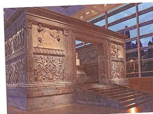
Ołtarz Pokoju (łac. Ara Pacis Augustae ) został wzniesiony przez Oktawiana Augusta jako symbol końca wojen i początku epoki pokoju. Budowlę zrekonstruowano w 1939 r.

Jednym z najważniejszych haseł w polityce Oktawiana Augusta był pokój w części świata opanowanej przez Rzymian, określane jako pax romana (z łac. 'pokój rzymski') bądź pax Augusta . W rzeczywistości ograniczał się on wyłącznie do zaniechania wojen domowych i dotyczył jedynie Italii oraz prowincji najwcześniej przyłączonych do imperium. Rzymianie kontynuowali ekspansję terytorialną, choć mniej dynamicznie niż u schyłku republiki. Zakończyli podbój Hiszpanii i rozpoczęli działania zbrojne w dolinach Renu oraz Dunaju. Ich głównym celem stało się ustanowienie północnej granicy państwa na Dunaju. Toczona tam wojna zakończyła się sukcesem Rzymian i utworzeniem nowych prowincji.