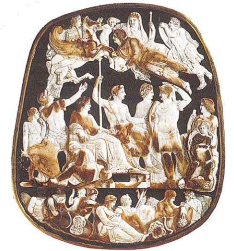
Wielka kamea francuska przedstawia w centralnej części cesarza Tyberiusza (postać siedząca po prawej na podwyższeniu), który panował w latach 14–37 n.e. Zmienne koleje losu jego rządów wiązały się z intrygami i walkami politycznymi w Rzymie. Tyberiusz zasłynął z talentów: wojskowego i administracyjnego. ■ gemma (płaskorzeźba w kamieniu szlachetnym), Rzym, 1. połowa I w. n.e.

Neron rządził Rzymem w latach 54–68 n.e. Tron zawdzięczał matce, Agrypinie Młodszej, która otrula swojego męża, Klaudiusza. Neron zasłynął z okrucieństwa i ambicji artystycznych nieodpowiadających rzeczywistości talentowi. ■ rzeźba, Italia, I w. n.e.