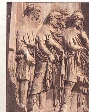
Jeńcy partyjscy przedstawieni zostali na rzymskim łuku Septymiusza Sewera. Za rządów tego cesarza u schyłku II w. n.e. Rzymianom udało się pokonać słabnące imperium Partów i włączyć do cesarstwa Mezopotamię.

Partia była początkowo jedną z satrapii imperium Persów, później zaś weszła w skład hellenistycznej monarchii Seleukidów. W połowie III w. p.n.e. miejscowy satrapa uniezależnił się jednak od obcej zwierzchności. Pod koniec II w. p.n.e. państwo to stało się mocarstwem. Zaczęło graniczyć z Rzymem po zajęciu przez niego w 64 r. p.n.e. Syrii. Konflikt między mocarstwami był nieunikniony. Pierwsza wojna zakończyła się klęską wojsk Krassusa pod Karrami w 53 r. p.n.e. Porażkę przyniosły również działania prowadzone na wschodzie przez Marka Antoniusza. Jednak uwikłani w konflikty wewnętrzne Partowie kilka lat później sami poprosili o rozejm. Politykę Augusta i Tyberiusza wobec potężnych sąsiadów cechowała ostrożność. Rzymscy władcy ograniczyli się do demonstracji siły oraz zadowolili się sukcesami dyplomatycznymi. Kolejne starcia w tym rejonie wybuchły za panowania Nerona. Doprowadziła do nich rywalizacja obydwu państw o wpływ w Armenii. Walki zakończyły się kompromisem oraz osadzeniem na armeńskim tronie władcy przychylnego Partom, który rządził jako wasał Rzymu.