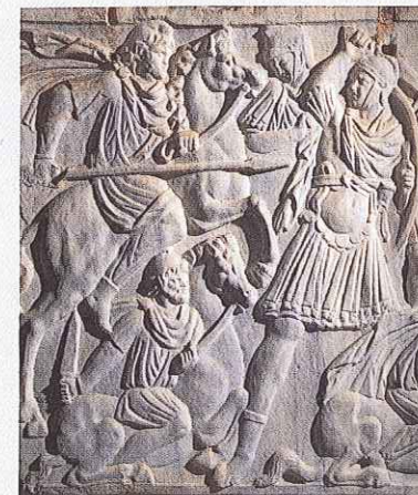
Walka legionistów z wojownikami ostrogockimi została przedstawiona na sarkofagu Ludovisi.

Zdaniem zwolenników teorii o zewnętrznych przyczynach upadku Rzymu imperium funkcjonowało sprawnie do momentu pojawienia się hord germańskich barbarzyńców. Wśród stawianych hipotez pojawiają się nawet i takie, że świetność Rzymu zakończyła się z powodu zmian w środowisku przyrodniczym lub degeneracji fizycznej Rzymian, do której doprowadziło wykorzystywanie łożysk rud wodociągowych.