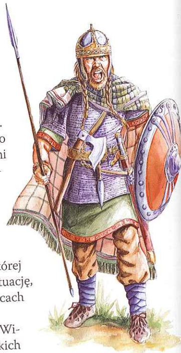
Wojownik germański był uzbrojony we włócznię. Podczas walki korzystał również z miecza lub topora. Chroniły go hełm, kolczuga i okrągła drewniana tarcza.