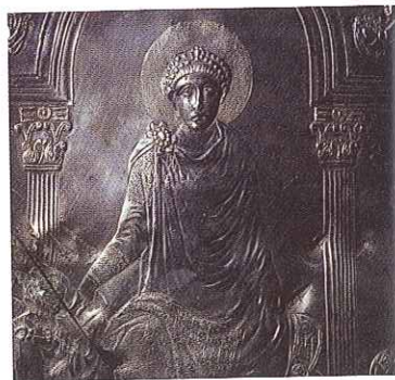
Teodozjusz Wielki był ostatnim władcą całego cesarstwa rzymskiego. Samodzielnie rządził nim jednak zaledwie przez trzy lata.

Na skutek zagrożeń wewnętrznych i zewnętrznych cesarz Dioklecjan u schyłku III w. n.e. wprowadził nowy system polityczny – dominat. Zmianom ustrojowym towarzyszyły liczne reformy, mające powstrzymać nasilający się kryzys. Wzmocniono siłę militarną imperium poprzez zwiększenie liczby legionów. Zmieniono strukturę armii i miejsca stacjonowania oddziałów. Dioklecjan usiłował też uzdrowić gospodarkę, jednak z gorszym skutkiem. Nie udało mu się położyć kresu wzrostowi cen, co próbował uczynić poprzez wydanie dekretu regulującego maksymalne ceny na różne artykuły pierwszej potrzeby oraz minimalną wysokość płac. Dobrym posunięciem okazała się natomiast reforma podatkowa , uzależniająca wysokość zobowiązań od typu upraw i jakości gruntów. Za rządów Dioklejana przeprowadzono także reformę administracyjną