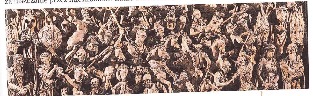
Scena walk Rzymian z barbarzyńcami

Od III w. n.e. dochodziło do niekorzystnych zmian społecznych, prowadzących do głębokiego kryzysu wewnętrznego. Rzymianie ze zmiennym szczęściem zmagali się z zagrożeniem ze strony Persów na wschodzie oraz plemion germańskich na zachodzie i północy. Ciągłe wojny rujnowały gospodarkę imperium, zmuszały rządzących do zwiększania liczebności armii, a w związku z tym do nakładania na ludność dodatkowych podatków. Obciążenia te stawały się coraz bardziej dokuczliwe dla obywateli, a w końcu trudne do udźwignięcia. Aby uniknąć płacenia podatków, nie tylko chłopci, lecz także mieszkańcy miast często zmieniali miejsca pobytu. W tej sytuacji władze wprowadziły prawo ograniczające przemieszczanie się, które w rzeczywistości oznaczało „ przywiązanie ” chłopów do ziemi . Członkowie władz miejskich mieli sprawować swoje funkcje dziedzicznie. To na nich ciążyła odpowiedzialność za uiszczanie przez mieszkańców miast wszelkich zobowiązań.