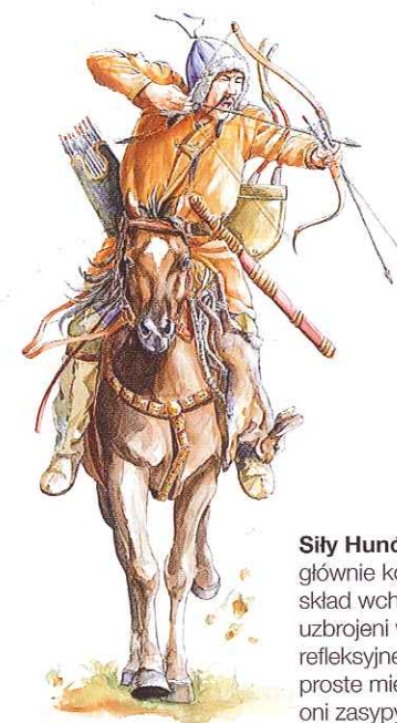
Siły Hunów stanowiła głównie konnica. W jej skład wchodził jeźdźcy uzbrojeni w krótkie łuki refleksyjne oraz długie, proste miecze. Potrafiliby oni zasypywać przeciwnika gradem strzał podczas jazdy.

Rzymowi nadal zagrażali Germanie, którzy podczas wielkiej wędrówki ludów masowo osiedlili się w zachodniej części cesarstwa. Sytuacja była o tyle niebezpieczna dla Rzymian, że to Germanie stanowili najlicniejszą grupę etniczną w rzymskiej armii. Nic dziwnego, że nie ocalili oni Rzymu przed swoimi pobratymcami, Wandalami , którzy w 455 r. n.e. wyruszyli z Afryki na łupieżczą wyprawę do Italii. Okrucieństwo tego ludu uczyniło go symbolem bezmyślnego barbarzyństwa. Wydarzenie to przyczyniło się do ostatecznego rozkładu cesarstwa zachodniorzymskiego. Gdy w 475 r. na tronie zasiadł małoletni Romulus Augustulus , sytuacja dawnego imperium była już beznadziejna. Cesarz nie utrzymał władzy nawet przez rok – w 476 r. n.e. obalili go służący w armii rzymskiej zbuntowani