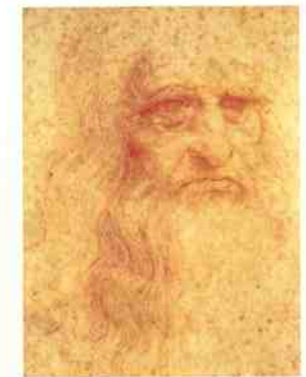
Leonardo da Vinci narysował swój autoportret pod koniec życia.

Mimo swojego niezwykłego umysłu da Vinci jako filozof i uczyony nie wywarł decydującego wpływu na współczesną mu epokę. Jego rękopisy zostały odkryte dopiero w XIX w. Przypominały nieuporządkowaną encyklopedię, jednak przedstawiono w nich wiele genialnych rozwiązań.