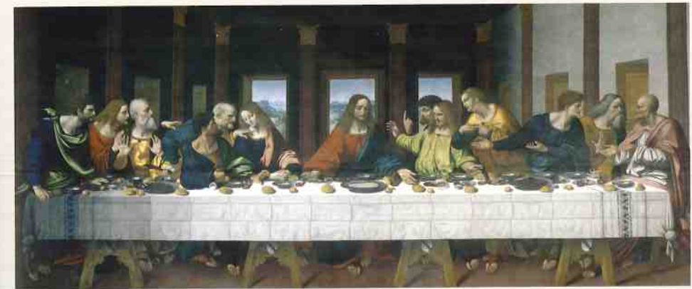
Fresk Ostatnia Wieczerza autorstwa Leonarda da Vinci zdobi ścianę refektarza w mediolańskim klasztorze Santa Maria della Grazie. Badacze doszukują się na obrazie różnego typu ukrytych informacji. Niektórzy sądzą, że bochenki chleba i dłonie apostołów są tak przedstawione przez twórcę dzieła, jakby tworzyły zapis nutowy utworu muzycznego.

■ rysunek, Francja lub Włochy, ok. 1515 r.