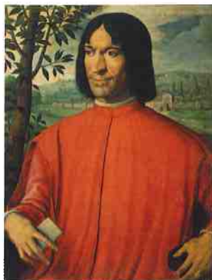
Wawrzyniec Wspaniały z rodu Medyceuszy (Lorenzo Medici) władał Florencją w drugiej połowie XV w. Za jego rządów miasto osiągnęło szczyt wpływów we Włoszech. Jako władca dbał o swój wizerunek, a z jego dworem byli związani najwybitniejsi twórcy renesansu, tacy jak Leonardo da Vinci, Sandro Botticelli i Michał Anioł.

? Dlaczego nazwa epoki – renesans – pojawiła się dopiero w XVIII w.?