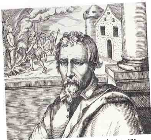
Miguel Servet (1511–1553 r.) jako człowiek renesansu był wszechstronnie wykształcony. Najważniejsze osiągnięcia miał jednak w dziedzinie medycyny – odkrył krążenie płucne krwi, a także stworzył podstawy nowoczesnej farmacji. Jako wolnomysliciel i zwolennik arianizmu został skazany na śmierć zarówno przez katolicką Świętą Inkwizycję, jak i protestancki sąd w rządzonej przez Kalwina Genewie. Ostatecznie został spalony na stosie przez kalwinistów.

Do zwolenników teorii Kopernika należał włoski fizyk i astronom Galileusz (1564–1642 r.), który za jej rozpowszechnianie stanął przed sądem kościelnym. Na mocy jego wyroku był przez niemal 10 lat więźniem politycznym papieżstwa. Ten wybitny uczynek jako pierwszy dostrzegł na Księżycu góry i doliny, a także obszary, które uznał za morza. Przy badaniu zjawisk przyrody stosował metodę doświadczalną. W jego czasach wnioskowanie indukcyjne na podstawie doświadczeń zastąpiło teologię scholastyczną, stanowiącą wcześniej przewodnią zasadę nauk przyrodniczych. Galileusz udoskonalił też kompas geometryczny i wojskowy, który umożliwiał precyzyjne ustawienie działa przed strzałem oraz obliczenie ilości prochu potrzebnej do wyrzucenia kuli. Odkrył również zjawisko bezwładności. Jest uważany za twórcę podstaw nowożytnej fizyki.