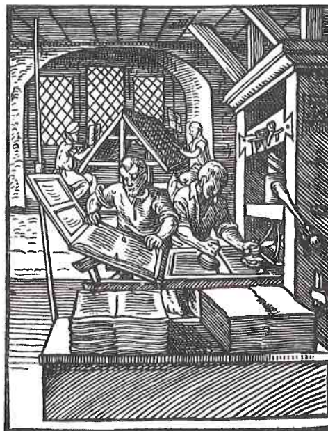
Pierwsze drukarnie były wyposażone w ruchome czcionki i prasy drukarskie wykonywane z pras do wina.

? Jaka rolę w średniowiecznej i nowożytnej Europie odgrywał teatr?